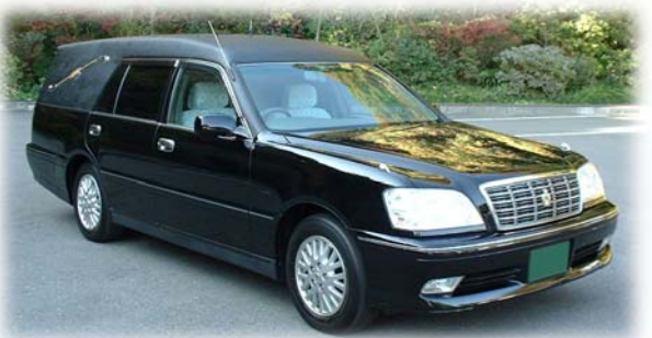
霊柩車 (10 km以内)