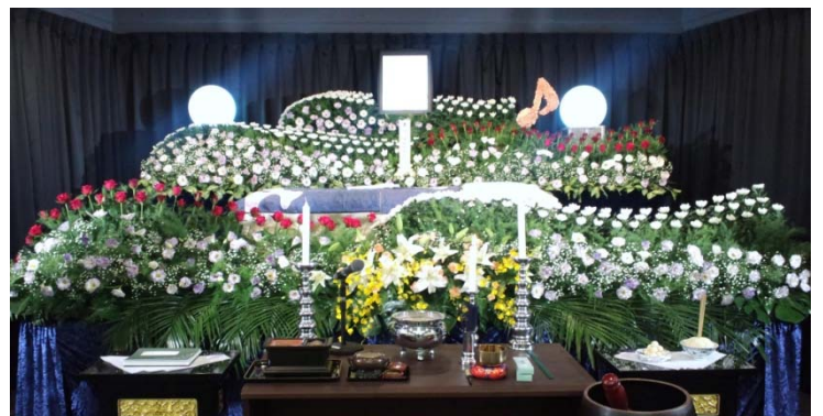
生花祭壇「安心の奏」