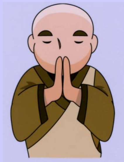
僧侶の御布施など