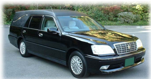
霊柩車 (10 km以内)